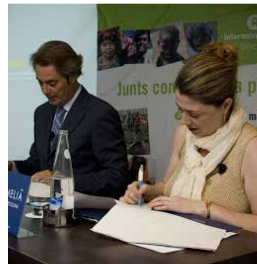
Firma del acuerdo entre la compañía Sol Meliá y la ONG Intermón Oxfam por "un comercio justo"

El denominado consenso de Washington, puso en marcha las nuevas reglas del juego, una vez caído el bloque socialista, es decir, el neoliberalismo, que no es sino la expresión de la tendencia del modo capitalista de producción a saltar sobre barreras nacionales, sociales y morales en un proceso de expansión permanente que liquida al tiempo los derechos sociales de los trabajadores, incrementa las contradicciones económicas y agudiza las crisis de sobreproducción. Algunas de las características de este nuevo periodo, son: